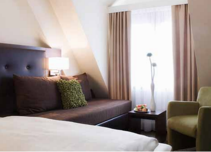
Wohnbeispiel Ambiente Klassik