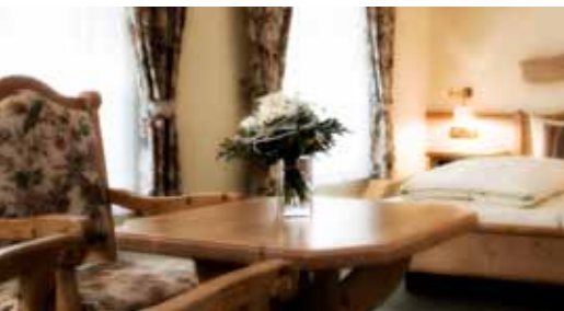
Wohnbeispiel Landhaus Apartment