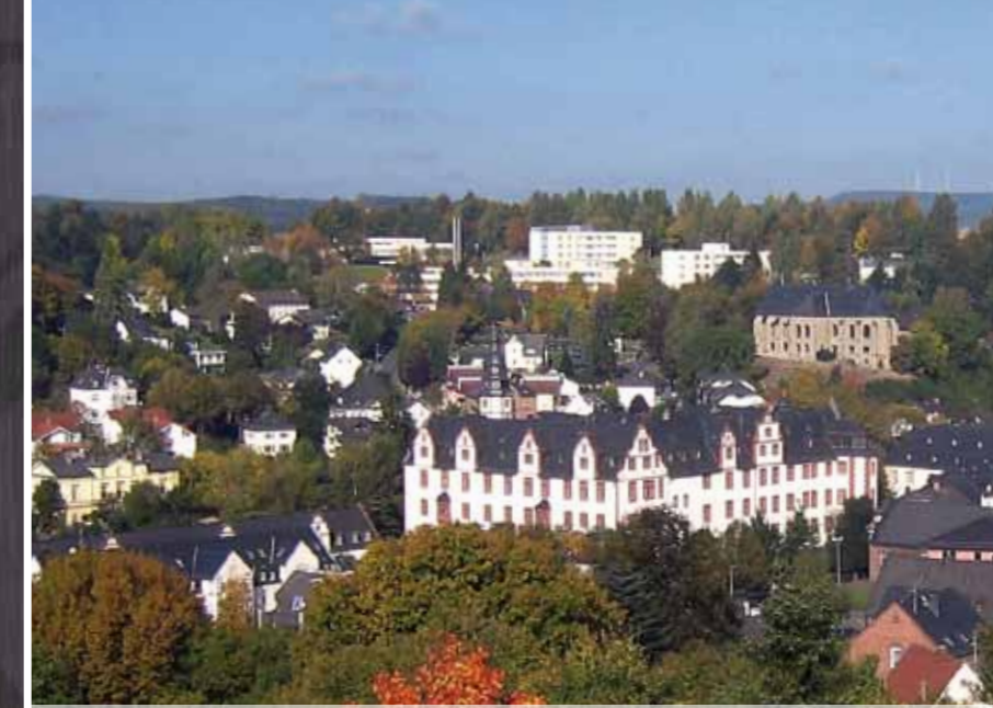
Renaissance-Schloss Hadamar (nur 150 m vom Hotel entfernt)

Das Ringhotel Nassau-Oranien bietet Ihnen den passenden Rahmen für Ihre repräsentative Konferenz, ein kreatives Meeting oder ein anspruchsvolles Seminar- in zentraler Lage mitten in Deutschland, guter Verkehrsanbindung und kostenfreien Parkmöglichkeiten.